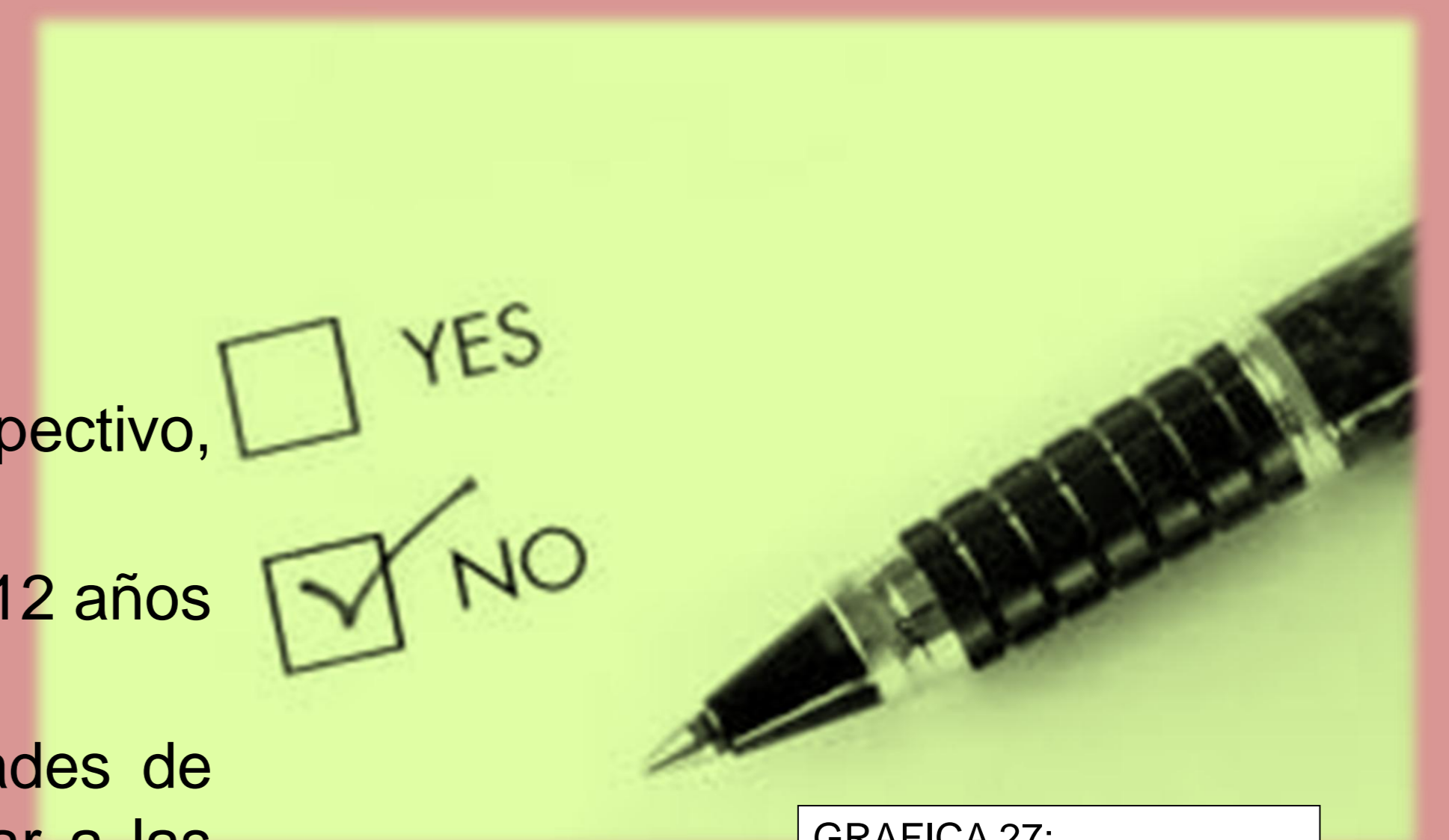
GRAFICA 27: ¿CADA CUANDO VA USTED AL DENTISTA?

Se solicitará por escrito el permiso a las autoridades de cada una de las instituciones para poder encuestar a las madres que acudan a ambos centros. Se solicitara por escrito el permiso de las madres que acudan a su atención en las instituciones mencionadas para encuestarlas.