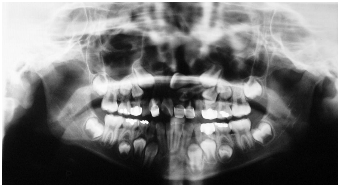
Figura 1. Ortopantomografía en la que podemos observar, los OD 21 y 22 impactados, en posición horizontal.

Escolar femenino de 10 años de edad, con peso de 24.5 kg y talla de 1.33 m, que se presenta a la clínica del Posgrado de Estomatología Pediátrica de la Facultad de Estomatología de la Benemérita Universidad Autónoma de Puebla, referida por el Hospital Universitario, con un diagnóstico de impactación dentaria del incisivo central y lateral superior izquierdo como se muestra en la radiografía panorámica (Figura 1). No refiere antecedentes heredofamiliares relevantes para el caso. Dentro de sus antecedentes personales no patológicos refiere que es procedente del Estado de Puebla, hábitos higiénicos deficientes, producto de la Gesta 1, Para 1, su madre cursó con un embarazo normoevolutivo a término. En los antecedentes personales patológicos tuvo un traumatismo en la región premaxilar a los 6 años de edad. En las fotos intraorales podemos observar pobre higiene oral, ausencia clínica de órgano dental (OD) 21 y 22 (Figura 2).