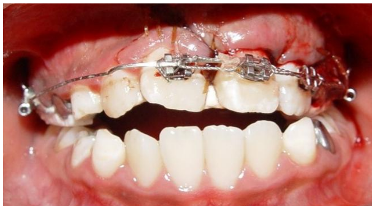
Figura 8. Con ionómero de vidrio en caras oclusales de molares y caras palatinas de incisivos, se sacaron de oclusión los OD reimplantados.

Se prepararon los OD 21 y 22 para la colocación del braquet, se fotocuró la resina para braquets. Después de la cementación de los braquets, se ferulizaron los OD con un arco rectangular de acero calibre 0.022 y ligadura metálica de 0.011 (Figura 5). Se mezcló el PRP con el hueso de bovino para obtener la membrana, la cual se coloca en el defecto óseo existente, procurando cubrir las raíces de los OD en toda su extensión (Figura 6). Se reposicionó el colgajo y se suturan los bordes con cat gut 3 ceros con puntos separados (Figura 7). Se coloca cemento de ionómero de vidrio en las caras oclusales de molares para evitar trauma de oclusión y en las caras palatinas de incisivos (Figura 8).