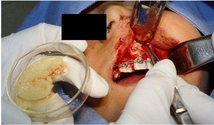
Figura 6. El defecto óseo y las raíces de los OD reimplantados se cubrieron con la mezcla de PRP y el hueso de bovino.