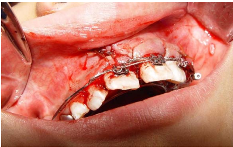
Figura 7. Se reposicionó el colgado y se suturó con puntos separados.