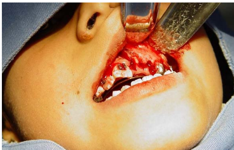
Figura 3. Se levanta el colgado tipo Newman modificado en tallo verde.