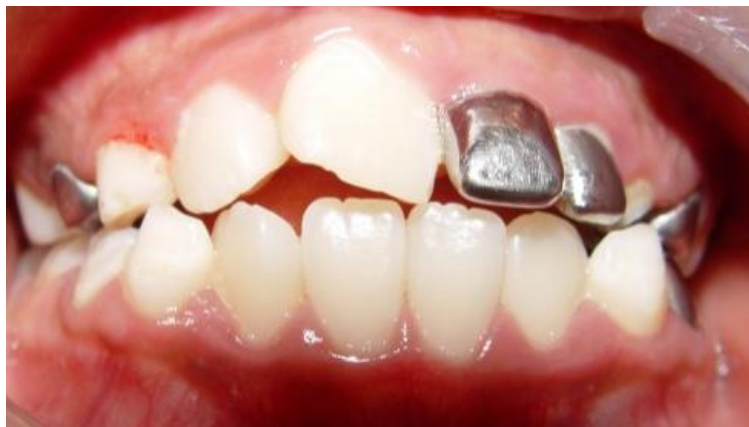
Figura 2. Se observan los OD 61 y 62 y pobre higiene oral.

favorecer una buena irrigación al sitio quirúrgico (Figura 3). Se descubrieron los OD impactados y se ubicaron en el nicho quirúrgico (Figura 4).