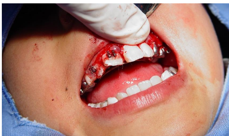
Figura 4. Se posicionan los OD 21 y 22 en el nicho quirúrgico.