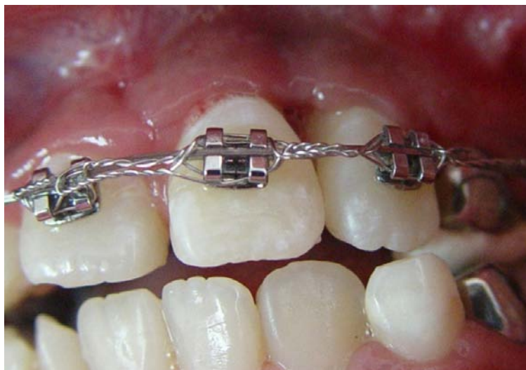
Figura 10. Siete semanas de evolución.

la mucosa oral, a las dos semanas se observó una mejor higiene oral y una buena cicatrización, se tomó una radiografía en la que se observa radiopacidad del injerto colocado (Figura 9). A las cinco semanas observamos una correcta cicatrización de la mucosa oral y migración de la papila de los dientes reimplantados. A las siete semanas no hubo mayor migración y el nivel de inserción de la encía fue aceptable (figura 10), así como la radiopacidad que observamos en la radiografía de control. Se siguió un plan preventivo que consta de técnica de cepillado tres veces al día, utilización de cepillo interdental, dieta baja en carbohidratos, profilaxis y aplicación tópica de flúor cada 3 meses.